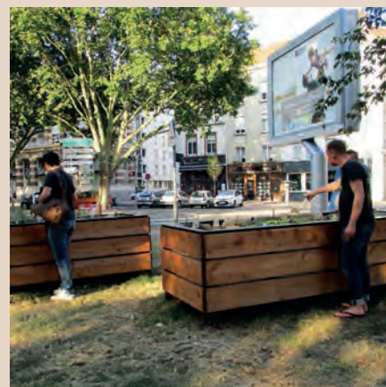
De grands bacs en bois sont mis à la disposition des habitants pour leur permettre de cultiver fleurs, fruits ou légumes.

Le véritable nœud du débat écologique, ce n'est pas seulement la nature : mais bien la place de l'homme en son sein.